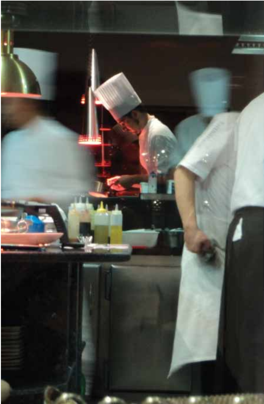
Cocina del restaurante Can Fabes del cocinero Santi Santamaria